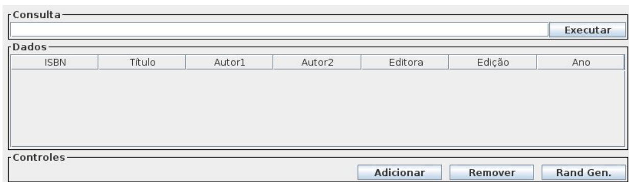
Figura 1: Tela inicial da interface gráfica

Compile o programa e execute-o. O programa deve exibir a interface gráfica da figura 1.