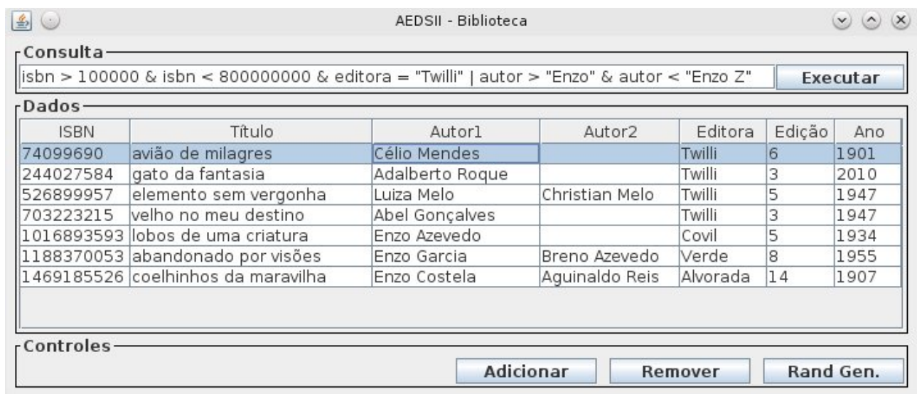
Figura 3: Resultado de uma consulta realizada na interface

Qualquer consulta que não esteja de acordo com essas especificações é considerada como erro pelo programa. Após digitar a consulta, clique no botão "Executar" para que o programa interprete a consulta. Vale ressaltar que cada um dos campos de consulta ( autor, editora, titulo e isbn) estão relacionadas ao seus respectivos índices. A Figura 3 mostra o resultado de uma consulta realizada no sistema.